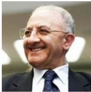
Vincenzo De Luca